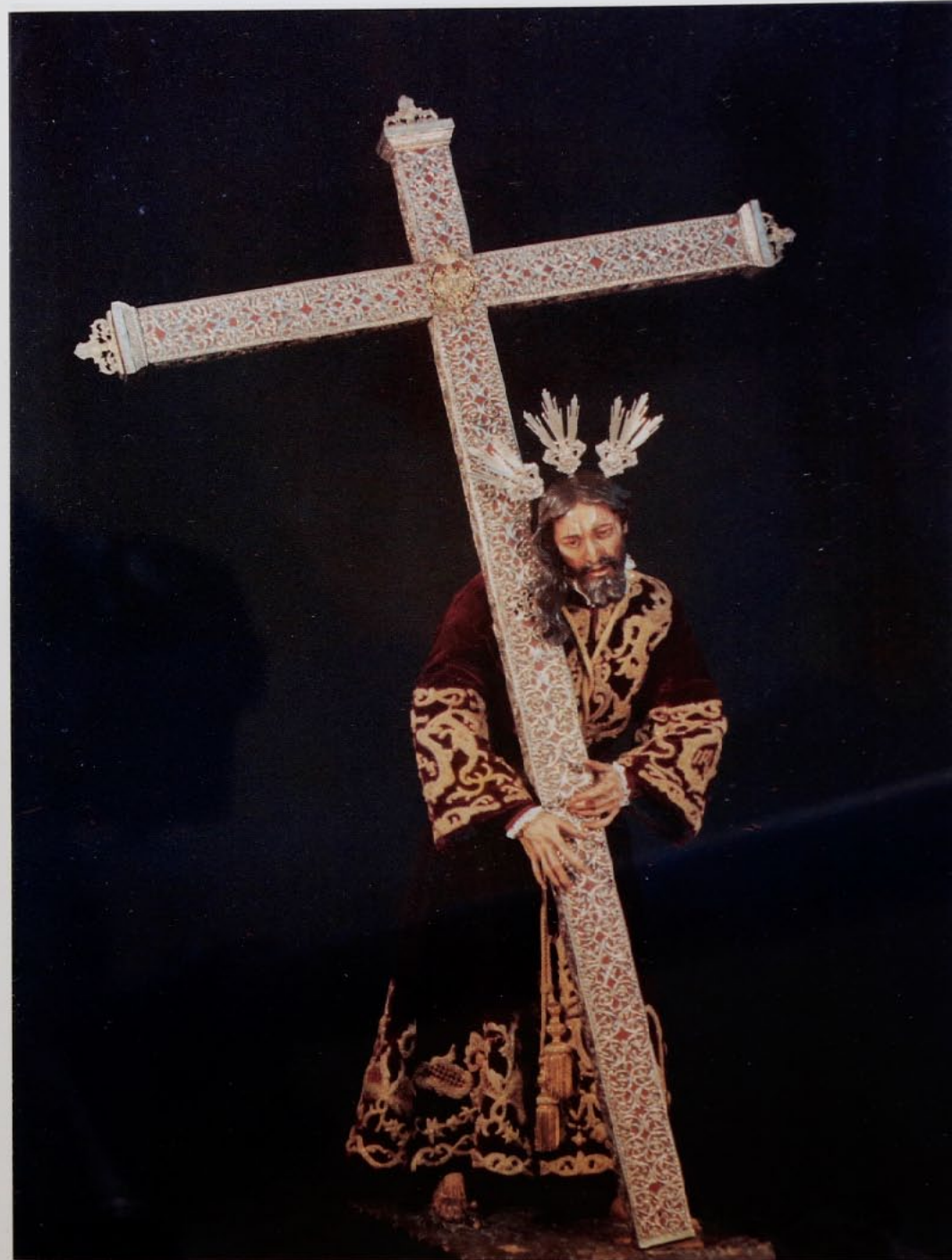
NUESTRO PADRE JESUS NAZARENO ABRAZADO A LA CRUZ